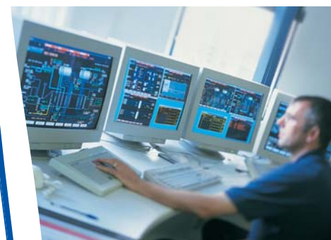
Apparecchiature critiche che richiedono due sorgenti elettriche indipendenti.