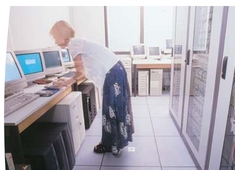
Doppia alimentazione per apparecchiature con singola alimentazione.