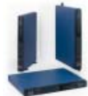
Pulsar Evolution 500 Für Rack, Tower oder Wandmontage.

Die USV-Serie Pulsar Evolution bietet Ihnen individuelle Montage- und Installationsmöglichkeiten.