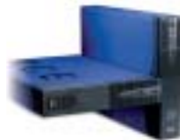
Pulsar Evolution Rack/Tower 2200/3000 Ein Modell für Tower oder 19" (2HE).