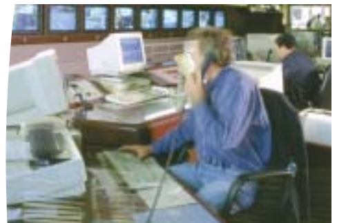
Dank der extrem kompakten Bauform ist die Pulsar Evolution die ideale Lösung für optimierte Platzausnutzung.