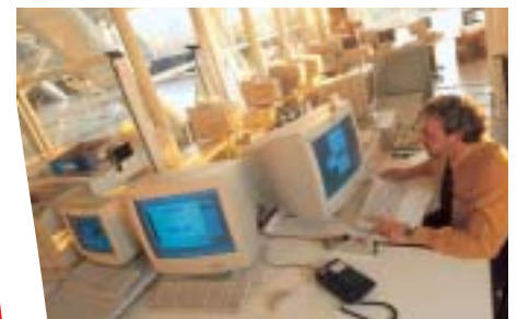
Pulsar Evolution steht für einfache Integration und Anpassung an jede Umgebung: Büro, Verkaufsterminal, 19"-Rack...